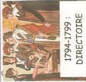
1794-1799 : DIRECTOIRE

*A partir de 1794, après la chute des Montagnards, s'installe le Directoire. Mais il du mal à trouver sa stabilité. La général Bonaparte en profite pour s'em- parer du pouvoir par un coup d'état le 18 brumaire an VIII (9 novembre 1799).