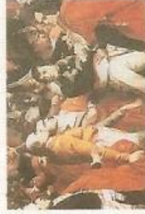
18 brumaire an VIII (9 novembre 1799)